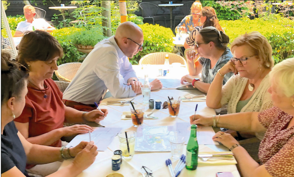
Er werd door alle deelnemers hard meegedacht over een nieuw beleidsplan!

Vol in de zon, in Willemstad, dachten we met een kleine groep na over een nieuw beleidsplan van de Stichting Cultuur Moerdijk. De voorganger, voor de periode 2017-2020 is toe aan een update. Als aftrap voor een boeiende en gezamenlijke discussie in de komende periode publiceren we deze inspiratiekrant.