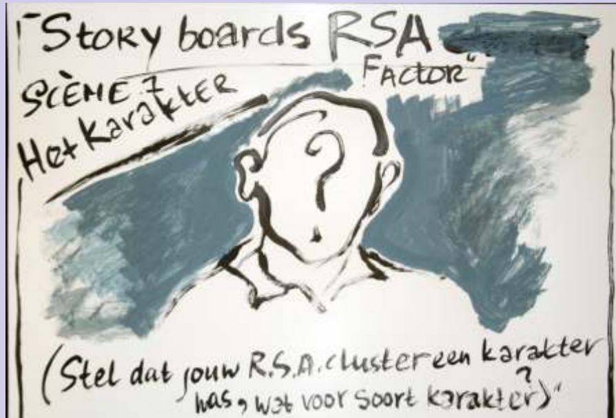
Op Weg Naar (Het) RSA (Festival)

Op 6 oktober 2011 kwam een verfijnde groep producenten en regisseurs bijeen. Op Weg Naar (het) RSA festival. In anderhalf uur bogen zij zich over een "story board" dat er toe doet. Ministerie van Verhalen hielp.