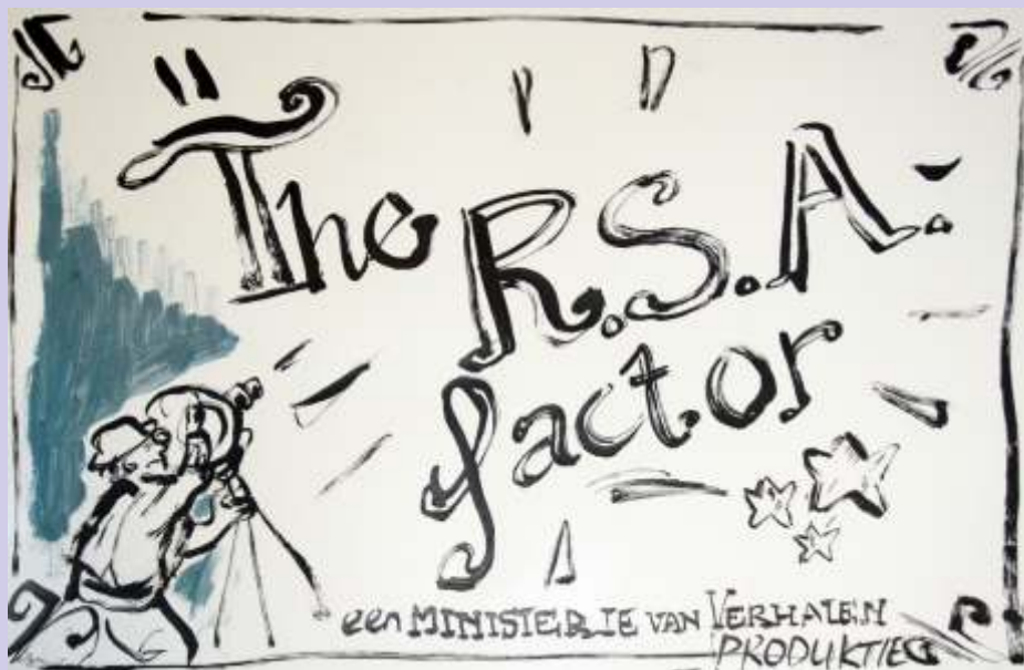
1 Het Karakter (RSA)

Op 6 oktober 2011 kwam een verfijnde groep producenten en regisseurs bijeen. Op Weg Naar (het) RSA festival. In anderhalf uur bogen zij zich over een "story board" dat er toe doet. Ministerie van Verhalen hielp.